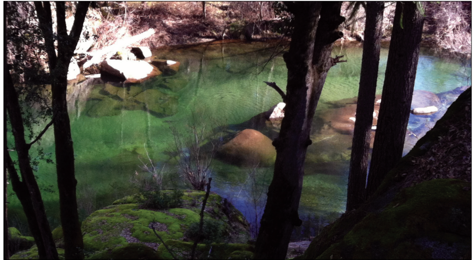
El agua para el área de servicio de Outingdale se desvía del río Middle Fork Cosumnes.

Las reuniones de la Junta Directiva del El Dorado Irrigation District están abiertas al público y se llevan a cabo el segundo y cuarto lunes de cada mes. Las reuniones comienzan a las 9:00 a. m. en el edificio de la sede de Placerville en 2890 Mosquito Road. Visite el sitio web del Distrito en www.eid.org para obtener más información.